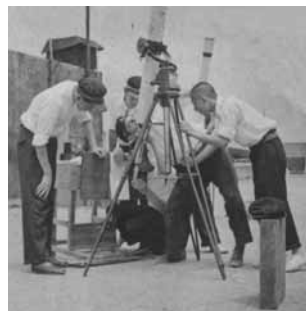
豊中高校「地球物理研究会」