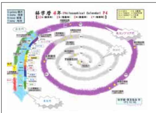
科学暦(上)と会旗(左;宇宙語、右;科学暦)